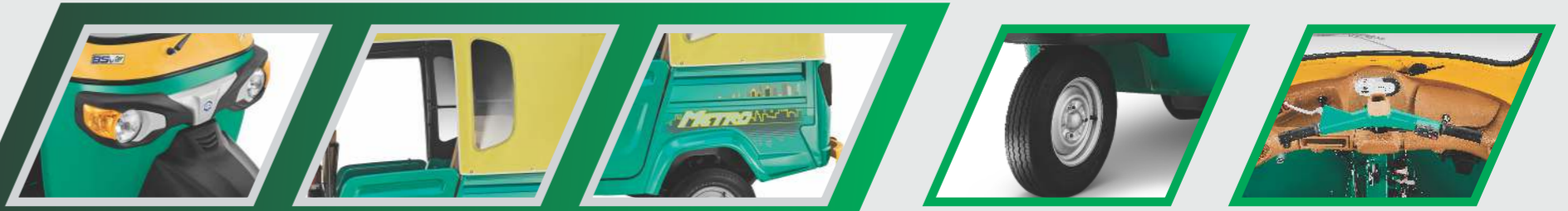
కొత్త డిజైన్ తోపాటు సైలిష్ డిజైన్