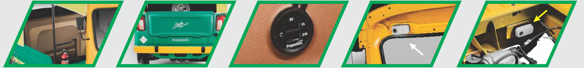
రెండు రంగుల సీట్