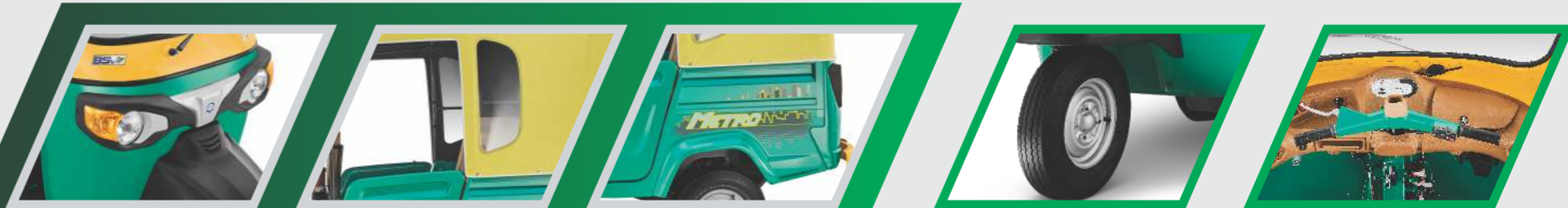
പുതിയ ഗ്രാഫിക്സ് ഉള്ള റൈറ്റലിങ് ഡിസൈൻ