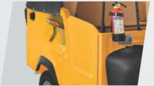
ପାସେଞ୍ଜର ସେଫ୍ଟୀ ଡୋର୍