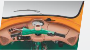
ମଲ୍ଟି ଇଂଫର୍ମେଟିଭ୍ ଡିସ୍ପ୍ଲେ