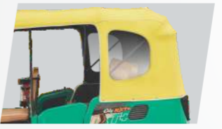
ବଡ଼ ଏବଂ ସ୍ୱଚ୍ଛ ଡ୍ରିଭିଂ ସହିତ ଷ୍ଟାଇଲିଶ୍ ସୁଡ଼