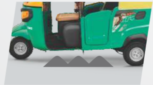
ଉଚ୍ଚତର ଗ୍ରାଉଣ୍ଡ କ୍ଲିୟରାନ୍ସ