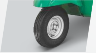
ରୁ୍ୟକଲେସ୍ ଟାୟାର୍ସ 3 ସ୍ୱାଇର ବର୍ଗରେ ପ୍ରଥମ