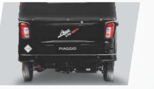
ସମସାମୟିକ ରିୟର ଲୁକ୍‌ସ୍