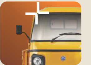
ಉತ್ತಮ ಬಿಲ್ಡ್ ಗುಣಮಟ್ಟ