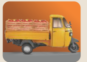
ಲೋಡ್ ಒಯ್ಯುವ ಕ್ಷಮತೆ ಅತ್ಯುತ್ತಮ