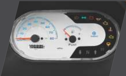
आधुनिक इन्फॉर्मेशन डिस्प्ले