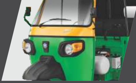
आकर्षक डिझाइन आणि स्टाइल