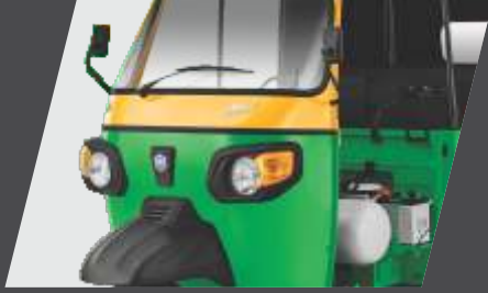
आकर्षक डिजाइन और अंदाज