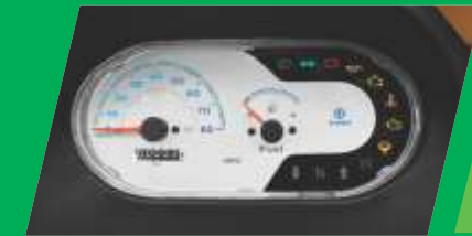
ਅਡਵਾਂਸਡ ਇੰਫਾਰਮੇਸ਼ਨ ਡਿਸਪਲੇ