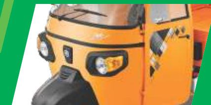
ਆਕਰਸ਼ਕ ਡਿਜ਼ਾਈਨ ਅਤੇ ਅੰਦਾਜ਼