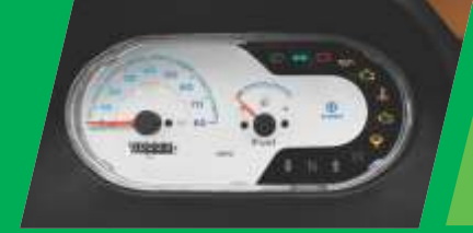
आधुनिक इन्फॉर्मेशन डिस्प्ले