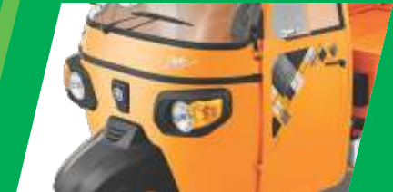
आकर्षक डिझाइन आणि स्टाइल