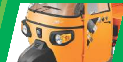
आकर्षक डिजाइन और अंदाज