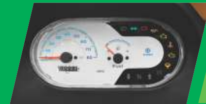
एडवांस्ड इंफॉर्मेशन डिस्प्ले