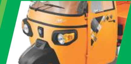
આકર્ષક ડિઝાઈન અને રુઆબ