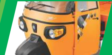
আকর্ষক ডিজাইন আর স্টাইল