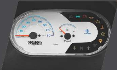
एडवान्स्ड इंफॉर्मेशन डिस्प्ले