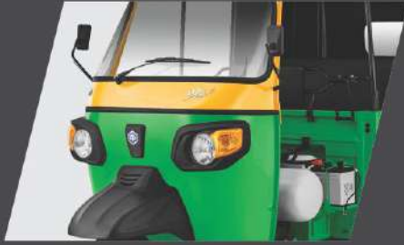
आकर्षक डिजाइन और अंदाज