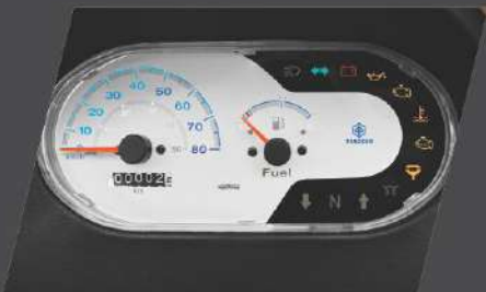
അഡ്വാൻസ് ഇൻഫോർമേഷൻ ഡിസ്പ്ലേ