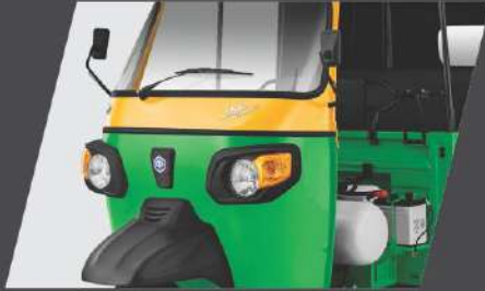
ആകർഷകമായ ഡിസൈനും രൂപവും