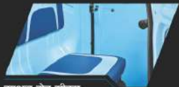
इयुअल टोन सीट्स