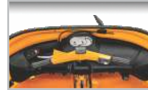
స్టైలిష్ డ్యాష్ బోర్డు