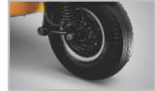
అదనపు దృఢమైన స్టీరింగ్ కాలమ్ మరియు చాసిస్