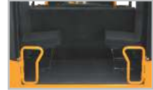
వెనుక ఫుట్ స్టెప్ ప్రవేశం