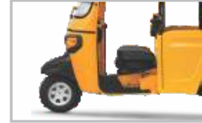
సౌకర్యవంతమైన డ్రైవర్ క్యాబిన్