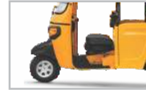
சௌகரியமான ஓட்டுநர் கேபின்