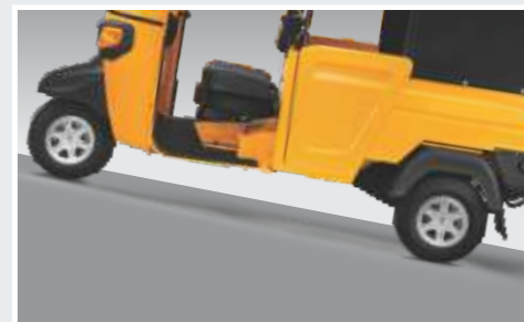
• ÖUS v ÓB + Av PÛ UP" Enh • ÖUS v ÓB