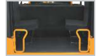
பின்புற நுழைவு படி