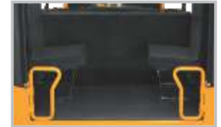
ਪਿਛਲੇ ਪਾਇਦਾਨ ਤੋਂ ਤਾਖ਼ਲਾ