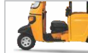
ଆରାମଦାୟକ ଡ୍ରାଇଭର କେବିନ୍

ନିୟନ୍ତ୍ରିତ ଇଞ୍ଜିନ୍ ଡାପମାନ ଓଟର୍ ଟେକ୍ନୋଲୋଜୀ ସହିତ