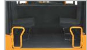
ପଛ ଫୁର୍ଣ୍ଣେସ୍ ଏଣ୍ଡ