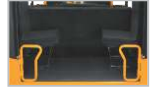
ৰিয়েৰ ফুটষ্টেপ এন্ট্রি