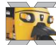
நவீன முன்புற தோற்றம்