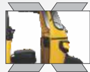
வசதியான ஓட்டுனர் அறை