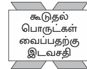
கூடுதல் பொருட்கள் வைப்பதற்கு இடவசதி