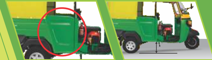
பெரிய அளவு வாகனம்