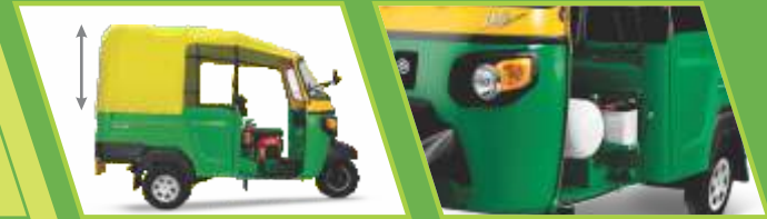
பெரிய அளவு வாகனம்