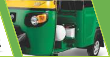
40 ਲੀ. CNG ਸਿਲਿੰਡਰ 20.6 ਲੀਟਰ LPG ਸਿਲਿੰਡਰ