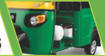
40 ലി. CNG സിലിണ്ടർ 20.6 ലി. LPG സിലിണ്ടർ