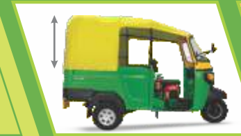
ಹೆಚ್ಚು ವಿಶಾಲವಾದ ಬಾಡಿ