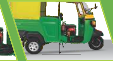
ಹೆಚ್ಚು ಗ್ರೌಂಡ್ ಕ್ಲಿಯರ್‌ನ್ಸ್

ದಯವಿಟ್ಟು ಗಮನಿಸಬೇಕಾಗಿರುವುದೇನೆಂದರೆ ಚಾರ್ಜ್‌ನಲ್ಲಿ ತೋರಿಸಿರುವ ಚಿತ್ರಗಳು ಹಾಗೂ ತಾಂತ್ರಿಕ ಮಾಹಿತಿಗಳು ಪ್ರದರ್ಶಿಸಬಹುದಾಗಿರುವ ದಿಡಿಭಾಗಗಳು ಹಾಗೂ ಉಪಕರಣ ಇದು ಸ್ಟ್ಯಾಂಡರ್ಡ್ ಫಿಟ್‌ಮೆಂಟ್‌ನ ಭಾಗವಾಗಿರುವುದಿಲ್ಲ. ಪಿಯಾಜಿಯೋ ಆಪೆ ಯಾವುದೇ ಮುನ್‌ಸೂಚನೆ ನೀಡದೇ ತಾಂತ್ರಿಕ ಮಾಹಿತಿಗಳು ಹಾಗೂ ವೈಶಿಷ್ಟ್ಯಗಳನ್ನು ಮಾರ್ಪಡಿಸುವ ಹಕ್ಕುಗಳನ್ನು ಕಾಯ್ದಿರಿಸಿಕೊಂಡಿರುತ್ತದೆ.