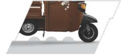
అత్యధిక గ్రౌండ్ క్లియరెన్స్