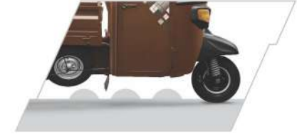
அதிக கிரவுண்ட் கிளியரன்ஸ்