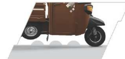
ਉੱਚਾ ਗ੍ਰਾਊਂਡ ਕਲੀਅਰੈਂਸ