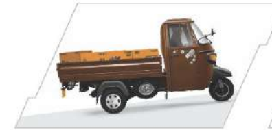
ਜ਼ਿਆਦਾ ਉੱਚਾ ਟਾਰਕ