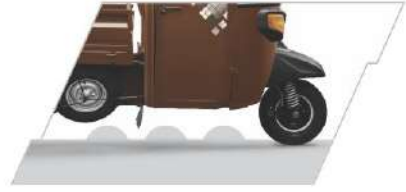
ഉയർന്ന ഗ്രൗണ്ട് ക്ലിയറൻസ്