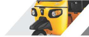
स्टायलिश इटालियन डिजाइन