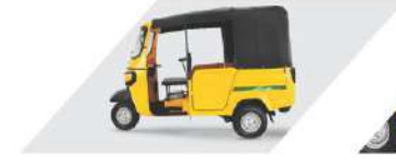
बेस्ट इन क्लास स्पेस