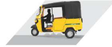
बेहतर ग्राउंड क्लियरेंस