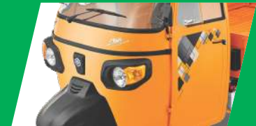
आकर्षक डिझाइन आणि स्टाइल