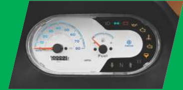
आधुनिक इंफॉर्मेशन डिस्प्ले