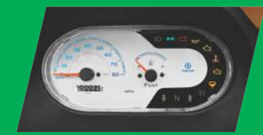
അഡ്വാൻസ്ഡ് ഇൻഫോർമേഷൻ ഡിസ്പ്ലേ