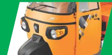
ആകർഷകമായ ഡിസൈനും രൂപവും