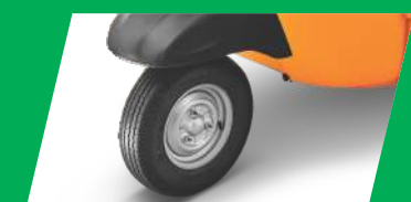
ട്രൂബ്ലസ്സ് ടയറുകൾ 3 വിലർ വിഭാഗത്തിൽ ഇതാദ്യമായി