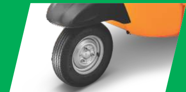
३ व्हीलर सेगमेंट में पहली बार ट्यूबलेस टायर्स