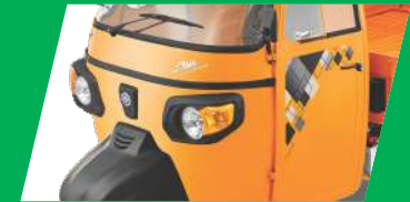
आकर्षक डिजाइन और अंदाज