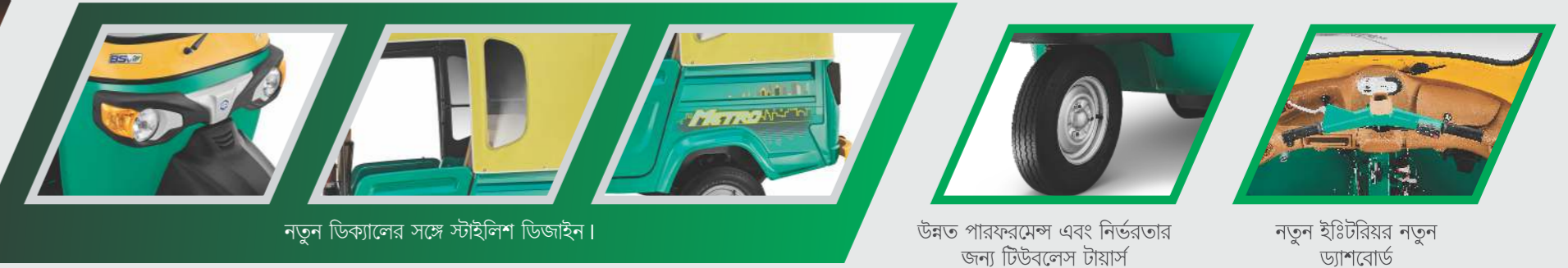
নতুন ডিক্যালের সঙ্গে স্টাইলিশ ডিজাইন।