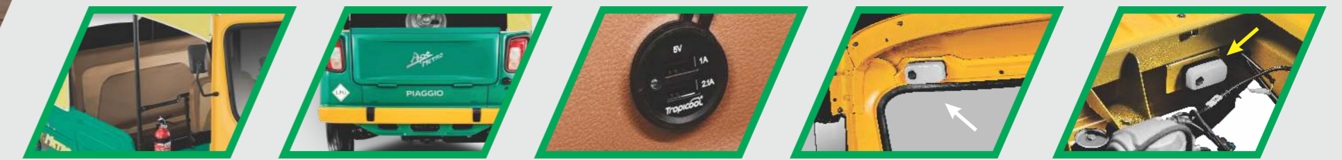
দুটো কালার সিট