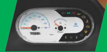
એડવાન્સ ઈન્ફોર્મેશન ડિસ્પ્લે