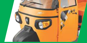
আকর্ষক ডিজাইন আর স্টাইল