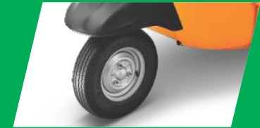
முதல் முறையாக 3 வீலர் பிரிவில் டியூப் இல்லாத டயர்கள்