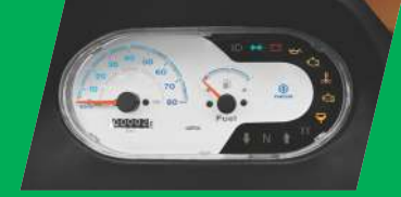
அட்வான்ஸ்டு இன்ஃபர்மேஷன் டிஸ்ப்ளே