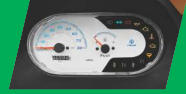
ಅಡ್‌ವಾನ್ಸ್‌ಡ್ ಇನ್‌ಫೋರ್ಮೇಷನ್ ಡಿಸ್‌ಪ್ಲೇ