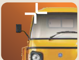
అత్యున్నత బల్ట్ క్వాలిటీ