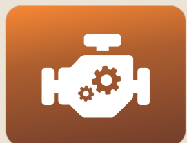
నమ్మకమైన 4-స్పీడ్ గేర్ బాక్స్