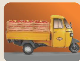
అత్యున్నతంగా లోడి మోయగల సామర్థ్యం