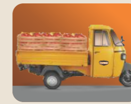
சிறந்த பாரம் தாங்கும் திறன்