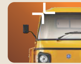
சிறந்த கட்டமைப்பு தரம்