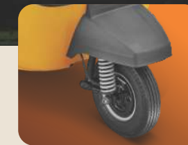
3 ହୁଲର ଶ୍ରେଣୀରେ ପ୍ରଥମ ଟ୍ୟୁବଲେସ୍ ଟାୟାର୍ସ