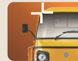
ଉତ୍ତମ ନିର୍ମାଣ ଗୁଣବତ୍ତା