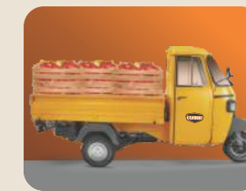
ଉତ୍ତମ ଭାର ବହନକାରୀ କ୍ଷମତା