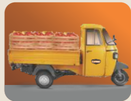
ಲೋಡ್ ಒಯ್ಯುವ ಕ್ಷಮತೆ ಅತ್ಯುತ್ತಮ