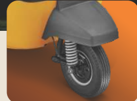
ತ್ರಿಚಕ್ರ ವಿಭಾಗದಲ್ಲಿ ಮೊದಲ ಬಾರಿ ಟ್ಯೂಬ್‌ಲೆಸ್ ಟಯರ್ಸ್