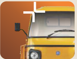
ಉತ್ಕೃಷ್ಟ ಬಿಲ್ಡ್ ಗುಣಮಟ್ಟ