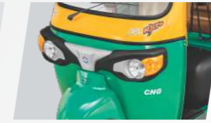
স্টাইলিশ ফ্রন্ট ফেসিয়া