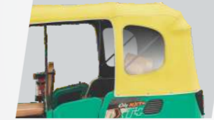
স্টাইলিশ হুড সহ বৃহৎ ও স্বচ্ছ উইন্ডো