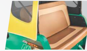
ডুয়াল টোন সিট