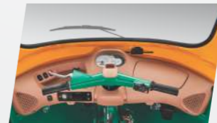
বহুমুখী তথ্যমূলক ডিসপ্লে