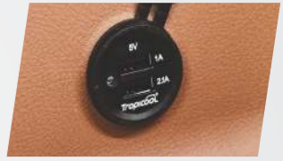
ডুয়াল পোর্ট ইউএসবি ফাস্ট চার্জার