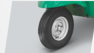
প্রথমবার 3 হুইলার সেগমেন্টে টিউবলেস টায়ার