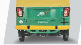
স্টাইলিশ রীড বাম্পার