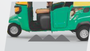
আরও বেশি গ্রাউন্ড ক্লিয়ারেন্স