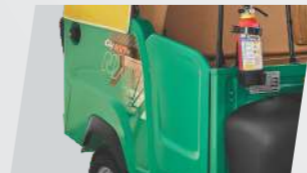
প্যাসেঞ্জার সেফটি ডোর