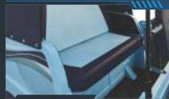
ଡୁଆଲ୍ ଟୋନ୍ ଇଣ୍ଟେରିୟର୍