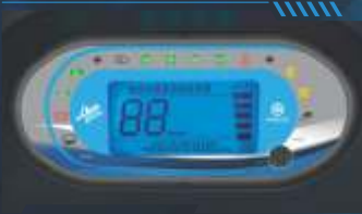
ପୁଲ୍ ଡିଜିଟାଲ୍ କ୍ଲଷ୍ଟର